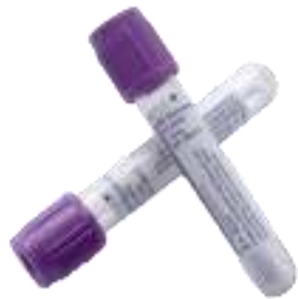
Tubos BD Vacutainer® con EDTA K2